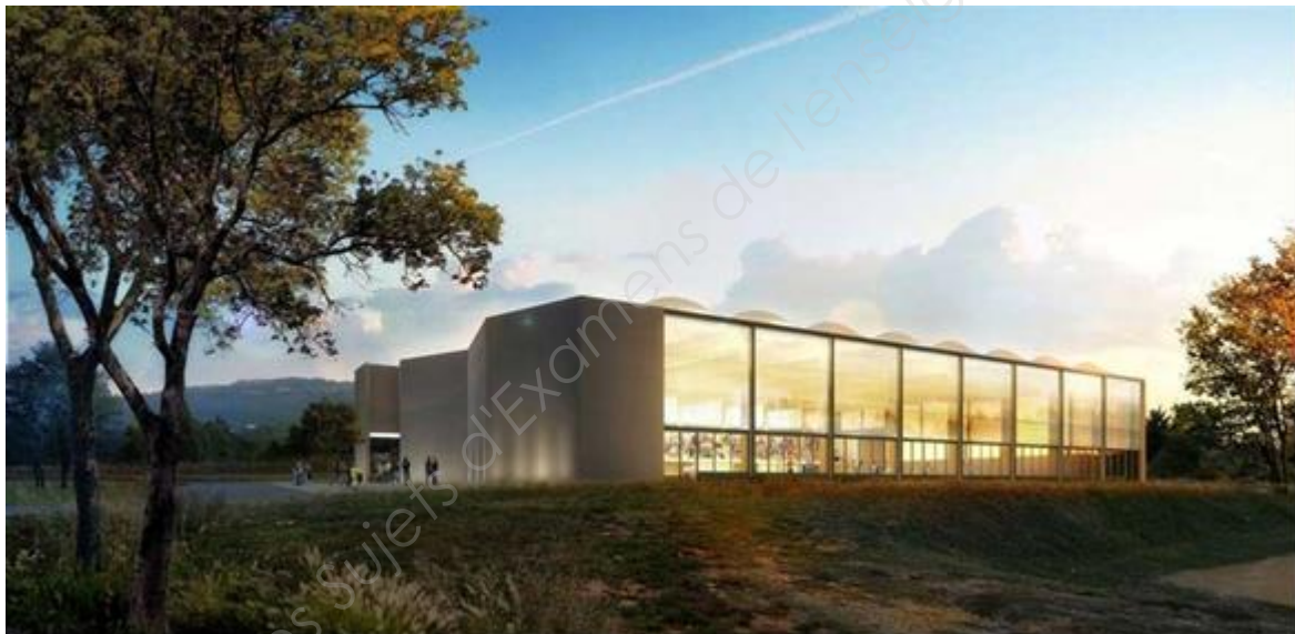
Construction d'un bâtiment à usage de gymnase

Tous les documents sont à rendre en fin d'épreuve. L'usage de tout modèle de calculatrice, avec ou sans mode examen, est autorisé.